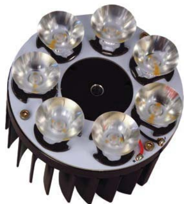
◀ Moteur « Goutal » développé par Ambiance Lumière spécifiquement pour la parfumerie.

projet, il m'est quasiment impossible de choisir des luminaires dans un catalogue ; le cahier des charges est d'une précision telle que l'étude d'éclairage se doit elle aussi d'être très spécifique dans le but de s'adapter au mieux au projet et de se fondre dans le concept architectural. Dans ces conditions, nous ne disposons que de très peu de temps pour faire réaliser un prototype et nous nous entourons d'industriels dont l'expérience et la dynamique permettent la fabrication d'appareils spéciaux sans risque pour notre client. »