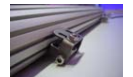
Fixation petit modèle

TRIAL est une fabrication sur mesure de barre de diodes de puissance IP68. Nous composons à la demande l'implantation des diodes, l'angle du faisceau, les mélanges de coloris selon vos choix avec la garantie des meilleurs composants pour des effets décoratifs sur mesure.