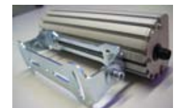
Fixation grand modèle